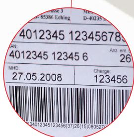
Etikettierung von Paletten und Kartons